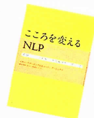
春秋社刊 「 心を変えるNLP 」